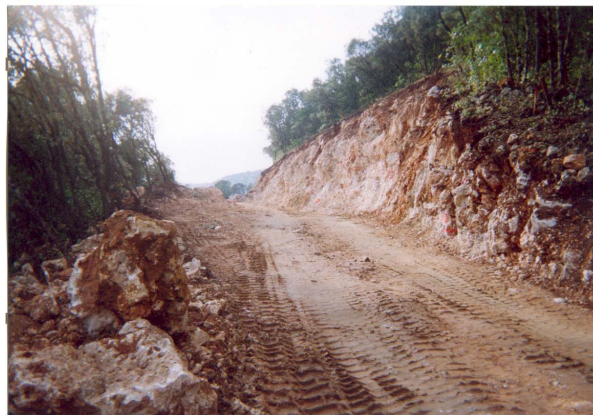
Travaux de construction de la route d'accès à la source des Cent-Fonts. Une partie de la piste est creusée à l'explosif (blocs de rochers).

Comment le rédacteur d'un article peut-il rendre compte sinon en rapportant les rumeurs qui circulent... à propos de tuyaux de détournement d'eau du bassin versant, d'installation et de travaux qui ressemblent plus à la construction définitive d'une usine qu'à la préparation d'une campagne d'essais objectifs.